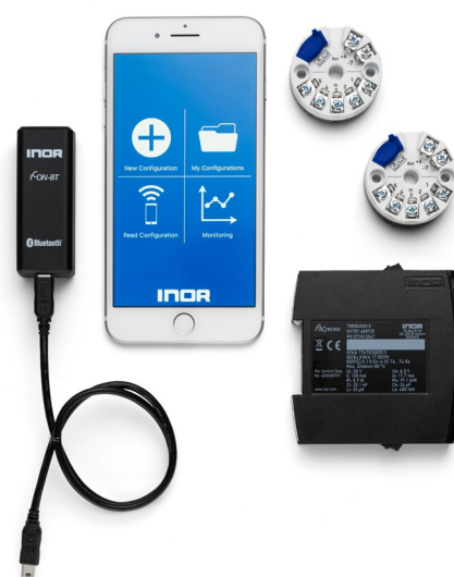
ICON-BT, INOR Connect e IPAQ C/R530

A configuração de um transmissor nunca foi tão fácil, prático e conveniente!